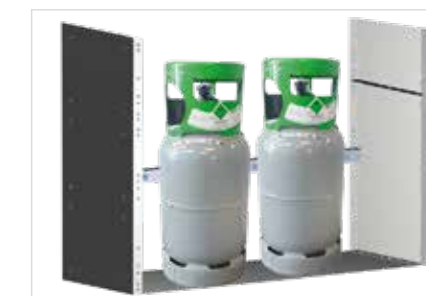
Rayonnage pour agents frigorigènes et gaz LxPxH: 1014x360x724 mm