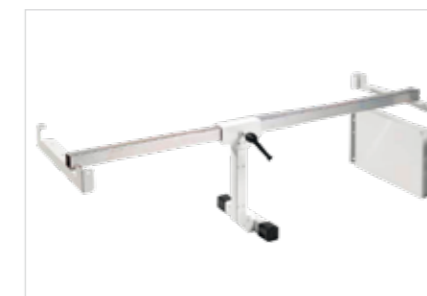
Système de fixation divers modèles