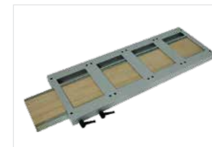
Établi coulissant droite ou gauche / différentes tailles