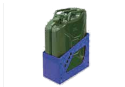
Support pour bidons LxPxH: 306x360x375 mm