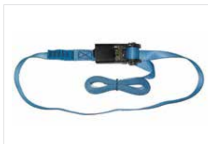
Sangles d'amarrage LxP: 3000x25 mm / Force de serrage: 800 kg

Quelques produits de notre assortiment. Vous en trouverez plus sur www.ecosystem.ch