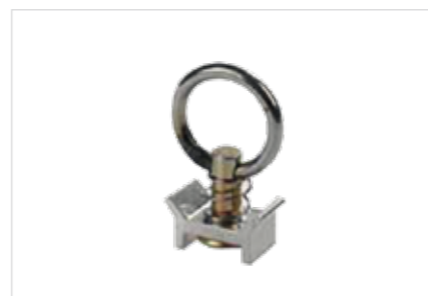
Anneau d'amarrage Raccord unique