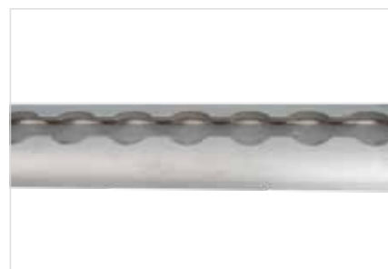
Rails d'amarrage divers modèles