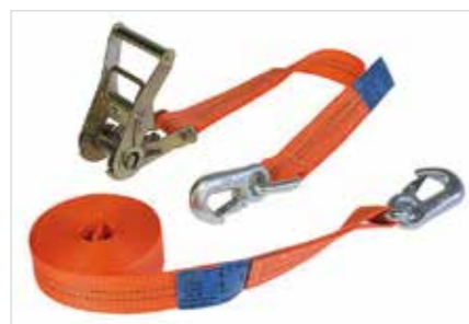
Sangles d'amarrage lourde LxP: 8000x50 mm / Force de serrage: 5000 kg