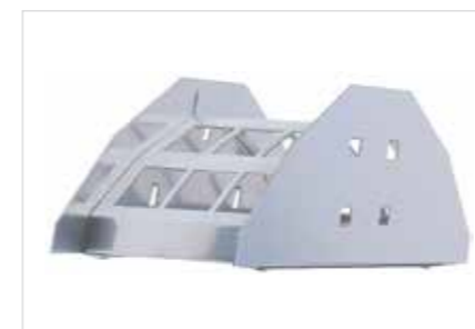
Support pour tuyau PxH: 230x125 mm